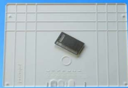
Strukturplatte digitale Mammographie