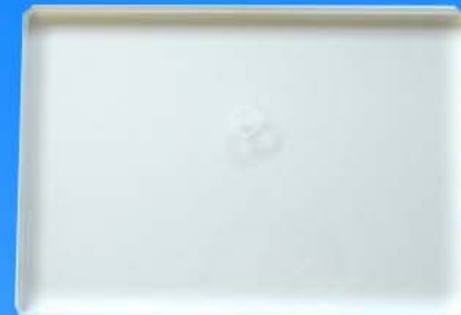
20mm Zusatzplatte in den Maßen

20mm thick additional plate with the dimensions