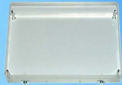
Grundphantom 40mm Acryl